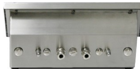
Vue arrière de 3590EGT